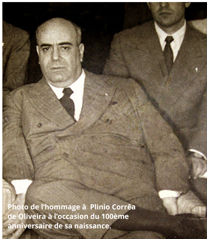
Photo de l'hommage à Plínio Corrêa de Oliveira à l'occasion du 100 ème anniversaire de sa naissance.