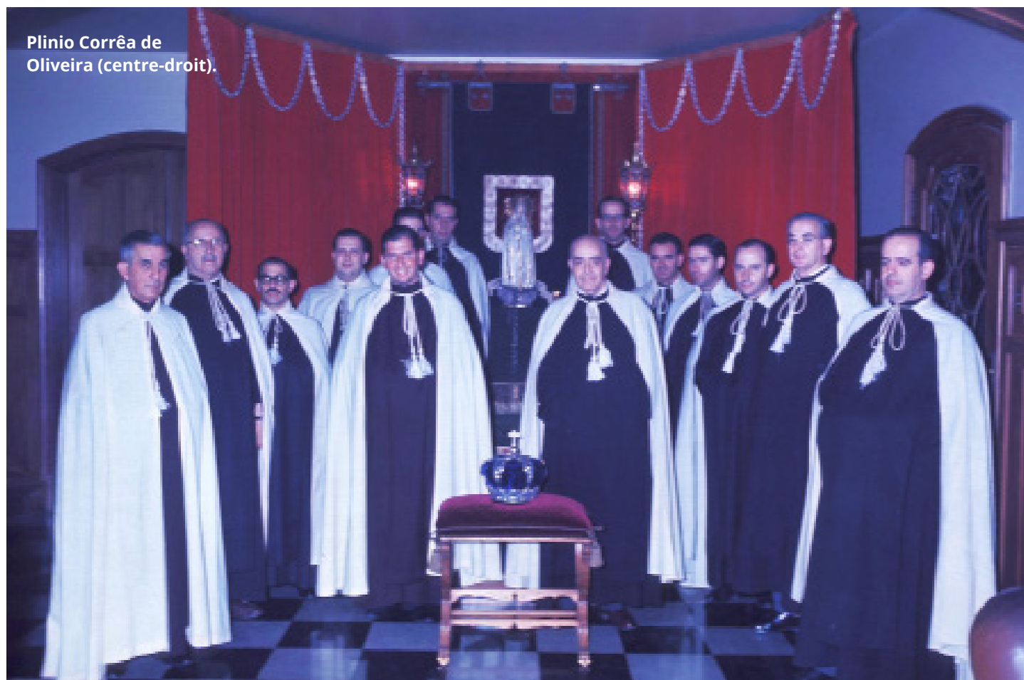
Plinio Corrêa de Oliveira (centre-droit).