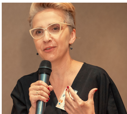
Hon. Joanna Scheuring-Wielgus, Députée

Comme ce rapport le montre, il ne fait aucun doute qu'il existe de puissantes forces interconnectées qui cherchent non seulement à restreindre les droits des femmes à la sexualité et à la procréation, mais aussi un retour en arrière en matière de droit à la parole et à l'expression des femmes en Europe en matière sociale, économique et politique. Les conclusions de ce rapport devraient effrayer toute personne ayant à cœur une Europe de citoyens libres et égaux. Pour cette raison, ce rapport est d'une importance cruciale pour tous les politiciens au niveau local, national et européen, dans la mesure où nous forgeons ensemble le futur de l'Union Européenne et de tous ses citoyens. Ce rapport offre aussi une opportunité à l'Europe, dans toute sa vitalité et sa diversité - organisations civiles, journalistes, politiciens, éducateurs, chercheurs et citoyens - de réaffirmer toutes les valeurs écloses en Europe depuis la Renaissance et qui ont conduit à la force culturelle, politique et économique de l'Europe d'aujourd'hui. Actuellement, plus que jamais, il est temps d'étendre et de renforcer les droits humains en Europe et de manière globale, de s'appuyer sur la science et les preuves pour formuler des évidences, et ne pas retourner en arrière dans l'obscurantisme du dogme.