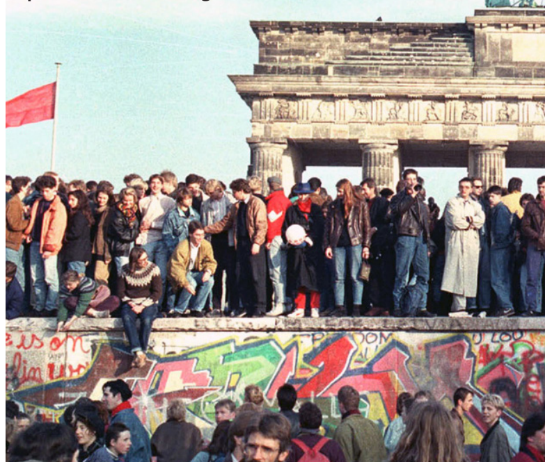
La Chute du Mur de Berlin, 1989. La photo montre une partie d'un mur de documentation photographique publique à la porte de Brandebourg, à Berlin.

gauchiste Frei et les réformes socialistes du gouvernement Allende.