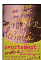
Avortement ; un choix, un droit, notre liberté. Les 30 ans de la loi Veil 40x60, 2005