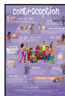
La contraception 40x60, 2014