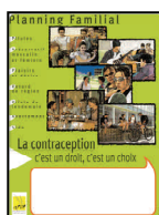
Planning Familial : la contraception, c'est un choix, c'est un droit 60x80, 2002