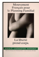
MFPPF : la liberté prend corps 40x60 ou 80x120, 1993