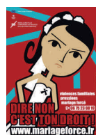
Mariage forcé : dire non, c'est ton droit ! Format A4 et A3, 2010