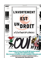
Affiche pour le lancement du nouveau site internet du Planning sur l'avortement, 40x60, 2014