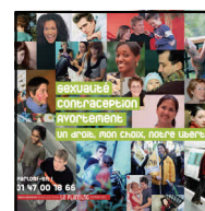
Affiche de la campagne Régionale Ile-de-France 40x60, 2008